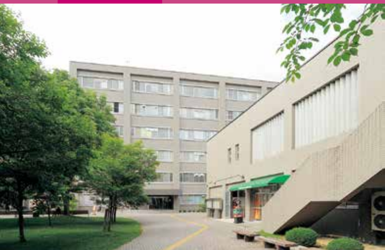
信州大学（松本キャンパス）