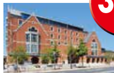
(写真は同志社大学)