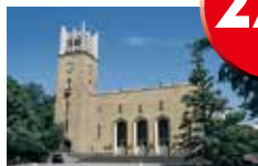
(写真は早稲田大学)