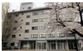
(写真は信州大学医学部)