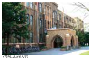
(写真は北海道大学)