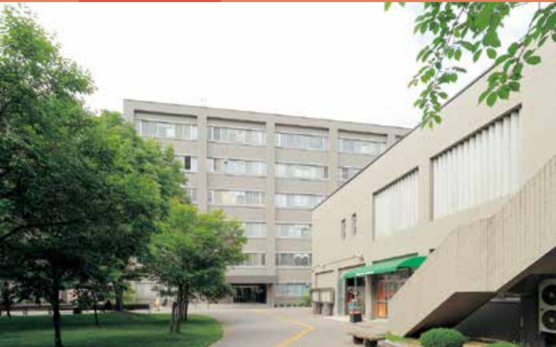
信州大学 (松本キャンパス)