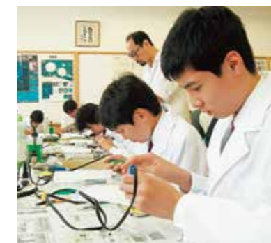
興味・関心を広げる学習活動

「授業」「体験学習」「館(寮)生活」それぞれが佐久長聖ならではの長所をもっています。また、それら三位一体の教育が、生徒一人ひとりの、高校での躍進につながり、ひいては一生にわたる素地づくりとなっています。