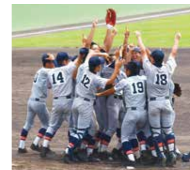
夏7回、春1回甲子園出場の野球部