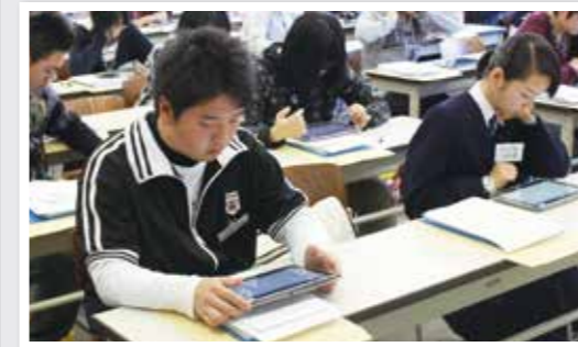
タブレット端末で授業動画を見る生徒

信学会シンボルマーク グローバルな視野と人間愛をもって世界に羽ばたく若人を表現しました。若人の情熱と人間愛をシンボルカラーの赤で表現し、グローバルな視野と豊かな人間性を円形で表現しています。また、「知・徳・体」の三位一体をめざして、持てる無限の可能性を伸ばしていく姿を、白で表現しています。