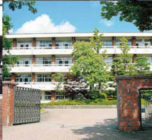
佐久長聖高等学校